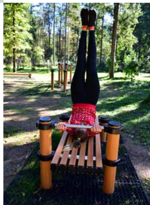
STREETWORKOUT VADBENI PARKI